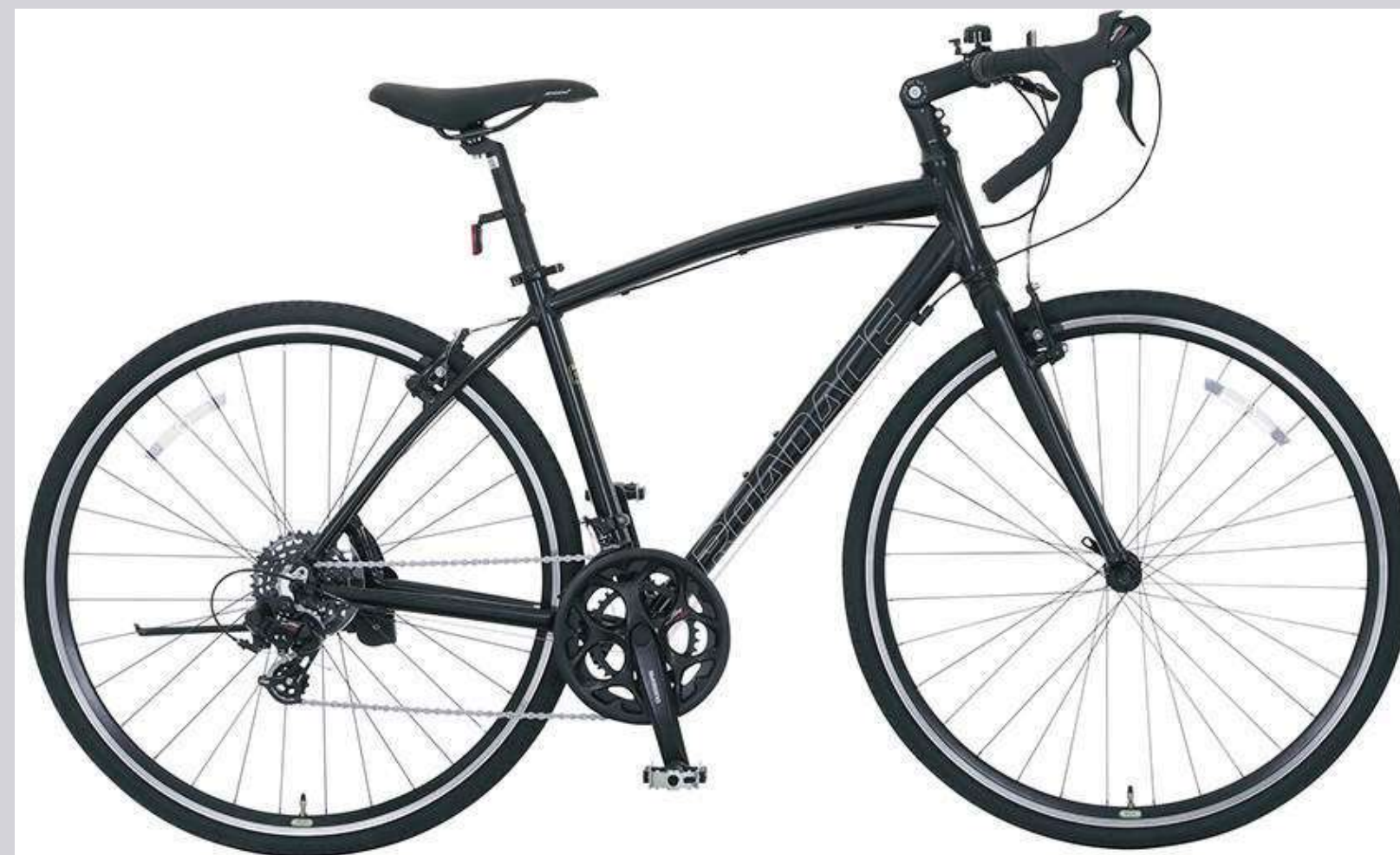
K65T(ハーフマットブラック)